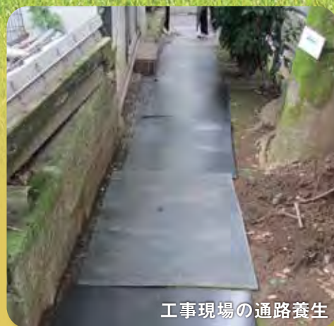
工事現場の通路養生