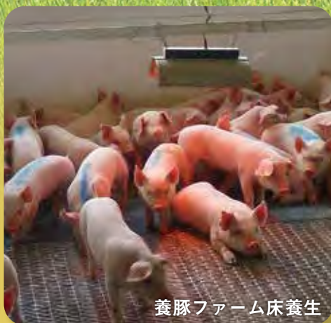
養豚ファーム床養生