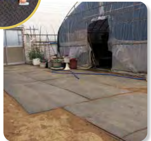
ビニールハウスアプローチ養生